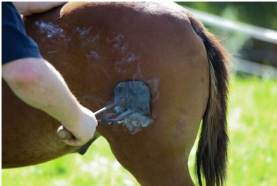
"Branding" To burn